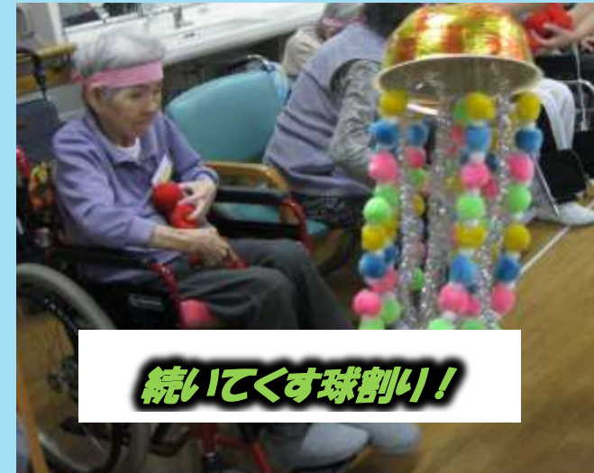
続いてくす球割り!