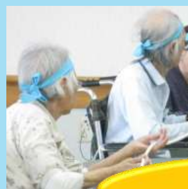
最後の勝負は筒送り!