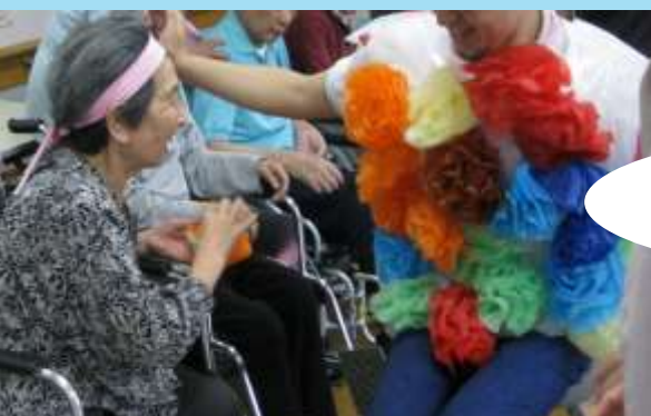
ちよっと一息 花いっばい