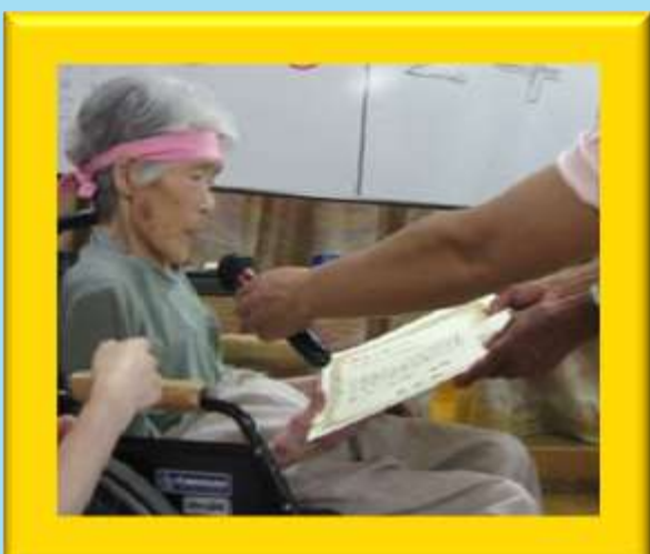
今年の優勝は赤組でした!