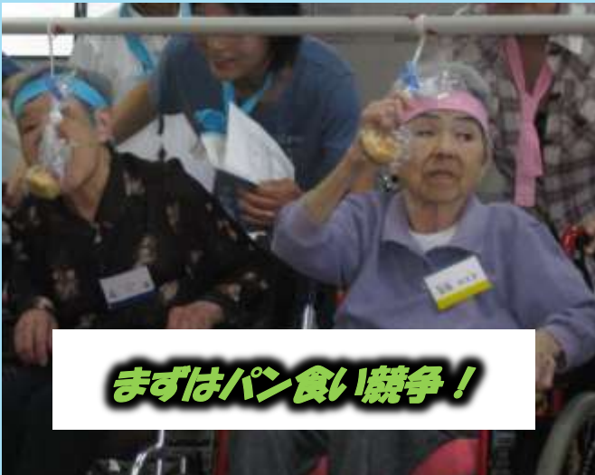
まずはパン食い競争!