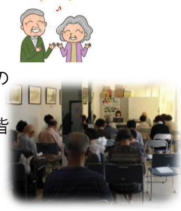
記念すべき第一回ジョイフル歌唱会!

75歳以上の方を対象に相原高齢者支援センターで、歌の会が9月から、始まりました。 『故郷』『赤とんぼ』などの童謡を、歌集を見ながら、皆でキーボードに合わせて歌いました。 楽しいひと時だったようです。 ○開催日:毎月第1月曜 13:30~15:00 ○参加には申込が必要です。